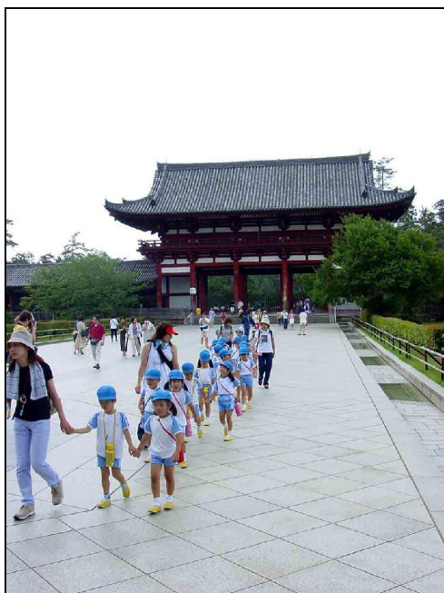
Elèves de cours primaire (noter l'alignement !)

L'école primaire (shogakko) et le collège (chugakko) durent respectivement 6 ans et 3 ans.