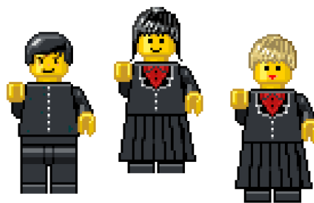
Collégiens en uniforme (fantaisie lego au lieu d'une photo !)

Il est à noter qu'au Japon, l'uniforme n'est pas l'apanage des écoles privées. Pour le japonais, l'uniforme permet de standardiser l'écologiste qui affirme son appartenance à un groupe plutôt que son individualité.